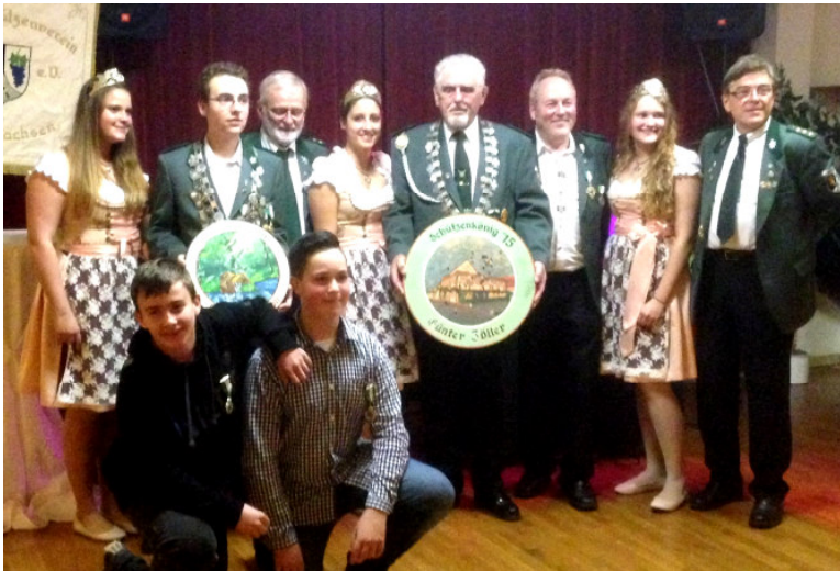
Die Geehrten mit den Lützelsachsener Weinhoheiten